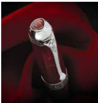
Il prezioso logo ovoidale

Azienda leader nella produzione e commercializzazione di strumenti di scrittura, fine pelletteria, orologi e carta, Aurora nasce a Torino nel 1919 . Da allora ad oggi non sono cambiati i valori che hanno reso l'impresa un leader internazionale nel settore: la passione per la bellezza e lo stile , unita alla cura per la qualità sin nei minimi dettagli.